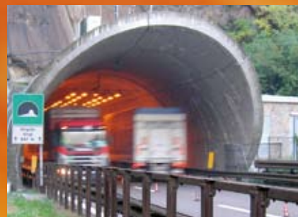
Tunnel « Virgolo », Italie

Les systèmes Fogtec installés ou en cours d'installation