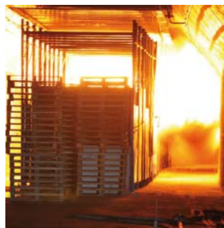
Essai feu pour Eurotunnel en Espagne