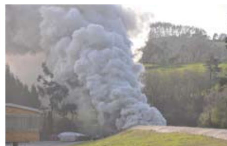
La fumée durant les essais feu