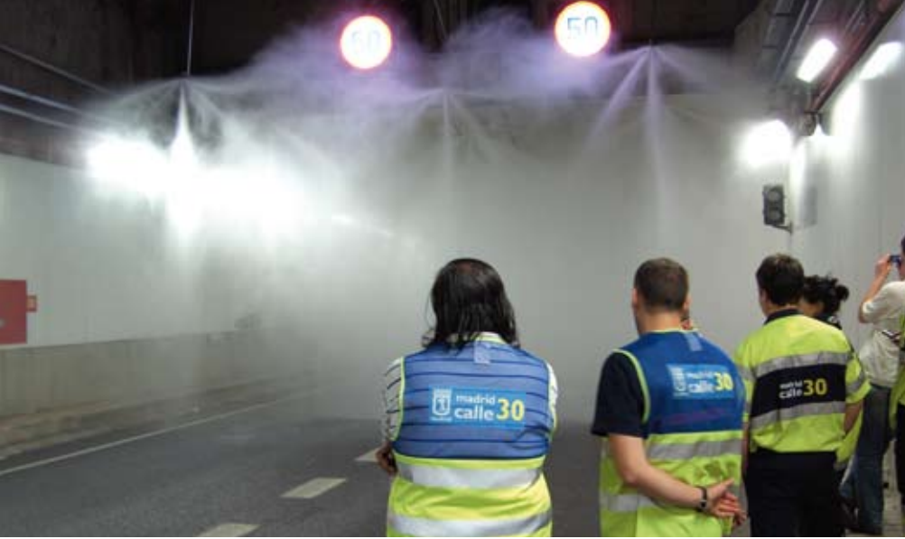
Installations approuvées et testées

Participation à des programmes de Normalisation et de Recherche: FOGTEC est très actif dans le milieu tunnelier et participe à de nombreux et différents programmes de recherche, de normalisation et groupes de travail.