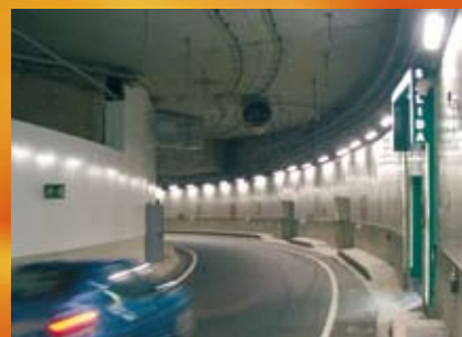
Tunnel « M30 », Espagne