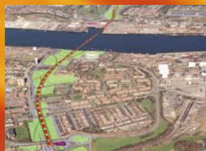
« New Tyne Crossing », Royaume-Uni