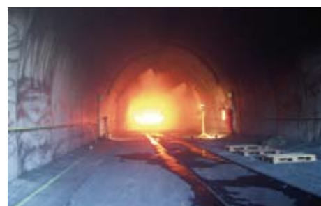
Essai feu UPTUN