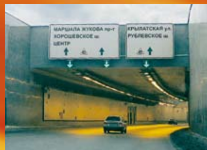
Tunnel « Silver Forest », Russie