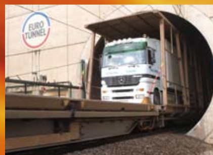
« Eurotunnel », France / Royaume-Uni