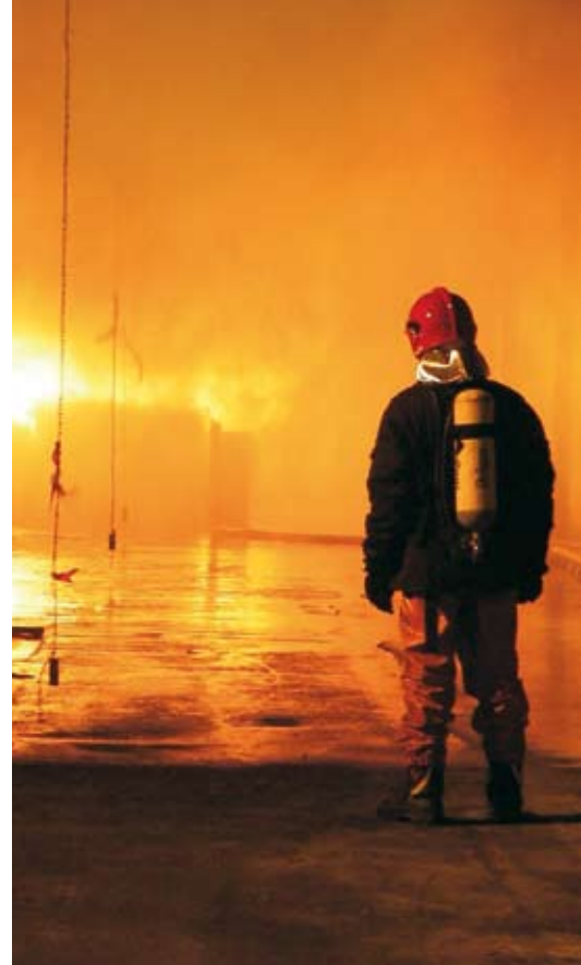
Essai feu SOLIT